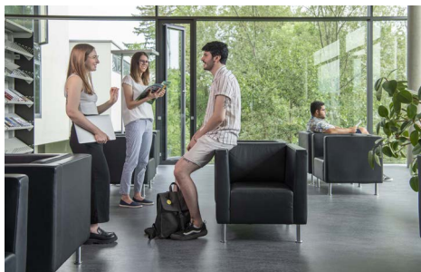
Pérolles 21

Vereins, da auch dieses Geschäftsjahr mit einem leichten Defizit abschloss. Es wurden verschiedene Ideen diskutiert, wo allenfalls Einsparungen gemacht oder zusätzliche Einnahmen generiert werden könnten. Die Vorschläge werden in den kommenden Vorstandssitzungen weiter verfolgt und ihre Umsetzung geprüft. Ebenso unerfreulich ist die nach wie vor negative Entwicklung der Mitgliederzahlen, welche auch im vergangenen Jahr wieder rückläufig waren. Trotz dieser nachdenklich stimmenden Situation blickten die an der Jahresversammlung anwesenden Mitglieder zuversichtlich in die nähere Zukunft und betonten die Wichtigkeit der VAF.