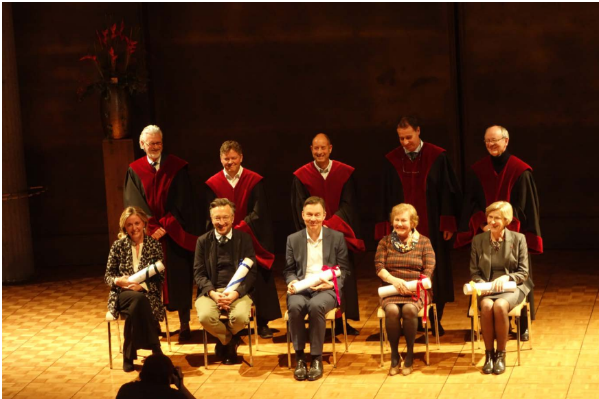
Les docteur·e·s honoris causa au Dies Academicus 2022 •

Ein ganz herzliches Dankeschön an alle Vorstandsmitglieder für ihr Engagement, ihre Treue und die fruchtbare Zusammenarbeit. Ein herzliches Dankeschön auch an die Alumni-Vereine der Fakultäten und Fachbereiche für den ausgezeichneten Austausch, der im Laufe des Jahres stattgefunden hat. Dank all dieser Kontakte können wir unseren Verein gedeihen lassen.