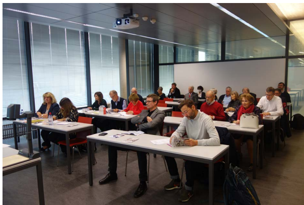
AG 2022 • GV 2022

conditions préférentielles pour certaines excursions et voyages ou encore pour des abonnements à la presse écrite. Vous trouvez toutes les informations sur le catalogue de prestations pour nos membres sur notre site.