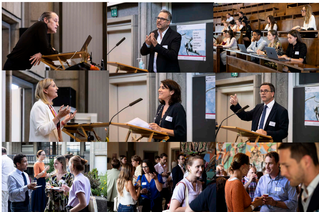
Impressions • Impressionen Service-Pack 2023

Am 14. November 2023 um 17.15 Uhr (Pérolles II) hält der Ehrendoktor 2023 der Rechtswissenschaftlichen Fakultät, Professor Pascal Ancel (Universität Luxemburg), einen Vortrag zum Thema: «Die Reformen des Schuldrechts in den drei Ländern des Code civil (Frankreich, Belgien, Luxemburg). Methoden und Inhalt» halten. Sie sind alle herzlich eingeladen. Die Präsentation endet mit einem Aperitif, der von den UniFR-Alumni gestiftet wird. Kommen Sie also zahlreich!