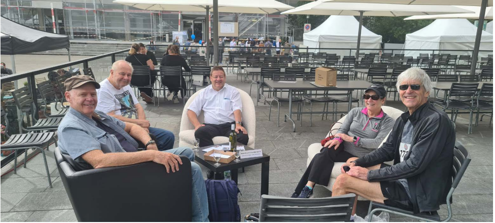
en haut • oben: Alumni-Friends from USA