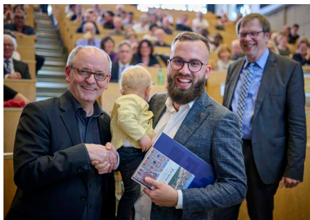
Cérémonie de remise des diplômes • Diplomfeier