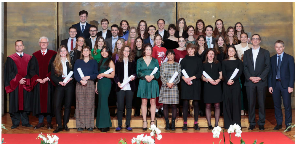
Aula Magna: Remise des diplômes fédéraux • Verleihung der eidgenössischen Diplome

Die Tradition des MedAlumni-Preises für den besten Bachelor begann im Oktober 2010, als der Bachelor in Medizin eingeführt wurde. An diesem Samstag, dem 29. Oktober 2022, konnte MedAlumni bei der Verleihung der Bachelor-Diplome in der Aula Magna vor einem Publikum voller Bachelor-Absolventen, deren Eltern und